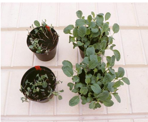
Mycostop-siemenpeittaus kukkakaalilla: Vas. Alternaria -taimipolte Oik. Alternaria -taimipolte + Mycostop-peittaus

Mycostop on saatavilla 2 g, 5 g, 10 g, 25 g, 50 g ja 100 g pakkauksissa. Säilyy avaamattomassa pakkauksessa 12 kk viileässä alle + 8°C. Soveltuu luomuviljelyyn ja integroituun kasvinsuojeluohjelmaan.