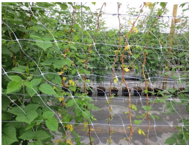
Juuristotaudit heikentävät merkittävästi versojen kasvua. Kuvassa oireita tunnelivadelmalla "Glen Ample"

Prestop on saatavilla 100 g ja 1 kg pakkauksissa. Tuote säilyy avaamattomana 12 kk viileässä, alle +8°C.