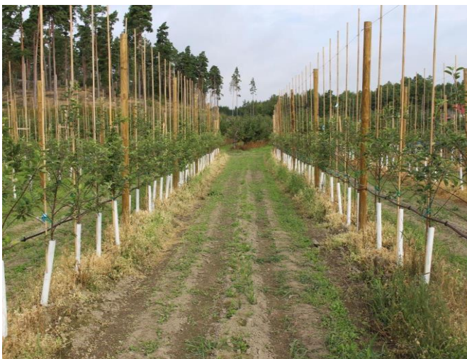
LALRISE VITA + MYC800

LALRISE VITA on saatavilla 1kg ja 5 kg pakkauksessa. MYC800 on saatavilla 600 g pakkauksessa. Säilytys suljetussa pakkauksessa huoneenlämmössä 20 kk ajan.