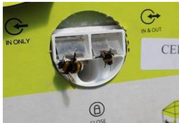
Humlor på väg ut genom en kommersiell mikrobspridare som har monterats på kupan.