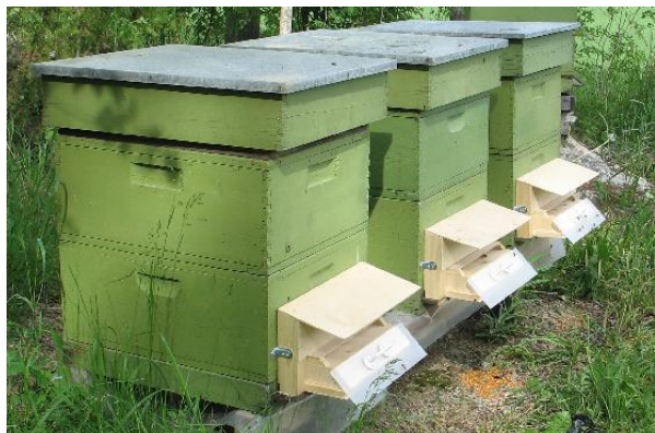
Mikrobspridaren Vekotin ® som monteras på bikupor har utvecklats i Finland (Aasatek Oy, www.aasatek.fi).