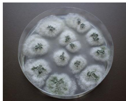
Bekämpningssvampen Gliocladium catenulatum

Kuporna som är försedda med spridningsaggregat för mikrober placeras ut vid åkerkanten genast när blomningen börjar och i aggregaten doseras 5-10 g Prestop® Mix varje dag under hela blomningen. Totalt går det åt 300-500 g av produkten per hektar. Med bin är antalet kupor 2 stycken per hektar och med humlor 2-3 trippelkupor per hektar på friland. I växthus och tunnlar behövs 1-2 stycken humlekupor/1000 m 2 . Mikropulvret är inte fukt känsligt och klumpar sig därför inte ens på friland. Det fastnar också bra på insekter som flyger ut för att pollinera. Bekämpningssvampen koloniserar vissnande blomdelar och förebygger på så sätt gråmögelangrepp på blombotten.