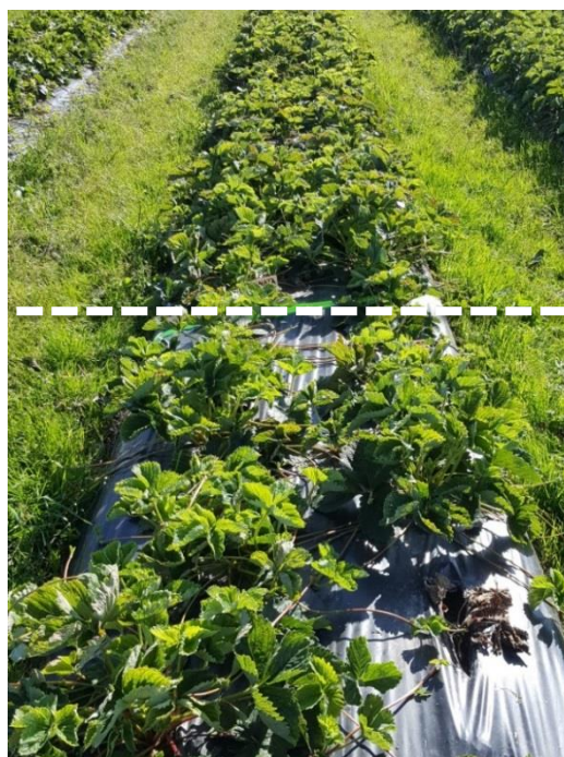
'Sonata' (A) obehandlad plantor framför, Prestop-doppningbehandlad bakom.