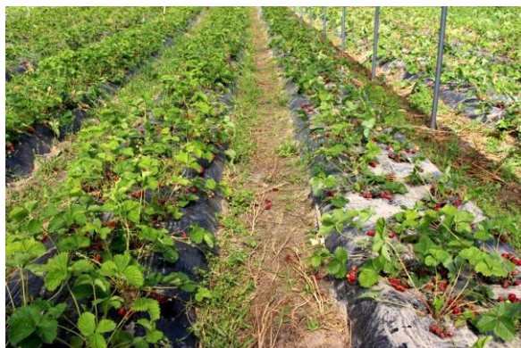
Prestop doppningsbehandling i planteringskedet och bevattningsbehandling 250 g/1000 plantor cirka 1 månad efter planteringen

Prestop finns att få i förpackningar om 100 g och 1 kg. Produkten är hållbar 12 månader i oöppnad förpackning om den förvaras svalt, under +8° C.