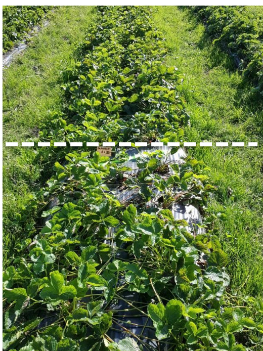
'Manille' (A+) obehandlad plantor framför, Prestop-doppningbehandlad bakom.

Försöket anläggades våren 2017 i kommersiell gård på olika jordgubbsskultivarer. Frigo plantor doppades snabbt i 0,5% Prestop-vattenblandning strax före plantering. Bilderna nedan är tagna 3 månader efter planteringen. Skörden samlades också i detta försök och det genomsnittliga tillägg var cirka 6,8 %.