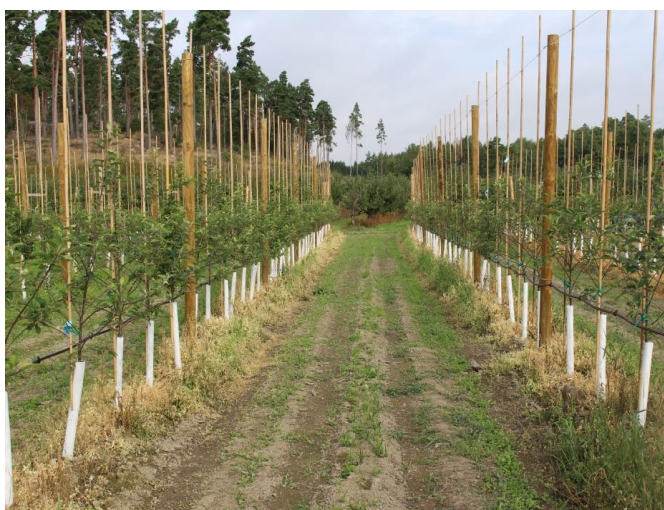
LALRISE VITA + MYC800

LALRISE VITA finns att få i förpackningar om 1kg och 5 kg. MYC800 finns att få i förpackningar om 600 g. Förvaring i rumstemperatur i försluten förpackning i 20 månader.