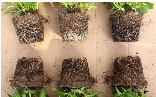
Kontrolli, "Lavblaa Blue"