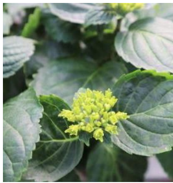
Prestop + Lalstim Osmo