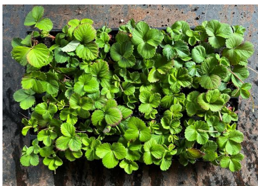
Prestop + Lalstim Osmo

Kokeessa havainnoitu 132 juuristoa/koejäsen