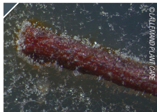
C. rosea J1446 juuren pinnalla

Clonostachys rosea J1446 asuttaa tehokkaasti kasvien juuret, lehvästön ja kukat.