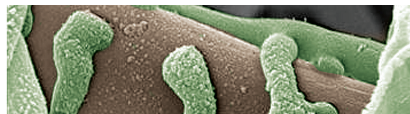
C. rosea J1446 kiertyneen taudinaiheuttajasienen ympärille

Clonostachys rosea J1446 tunkeutuu taudinaiheuttajasieniin ja hajottaa niitä aineenvaihduntatuotteillaan.