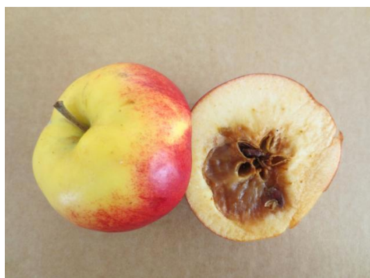
Symptom på kärnhusröta på sorten 'Santana'.

Prestop Mix finns att få i förpackningar om 1 kg och 400 g. Förvaras svalt och torrt, håller sig 12 mån. i öppnad förpackning under +8°C. En öppnad förpackning håller sig 1 månad om den försluts på nytt och förvaras under +8°C.