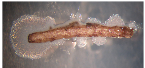
Bacillus -hyötymikrobin asuttama juuri. Hyötymikrobi muodostaa juuren pinnalle suojaavan biofilmin.