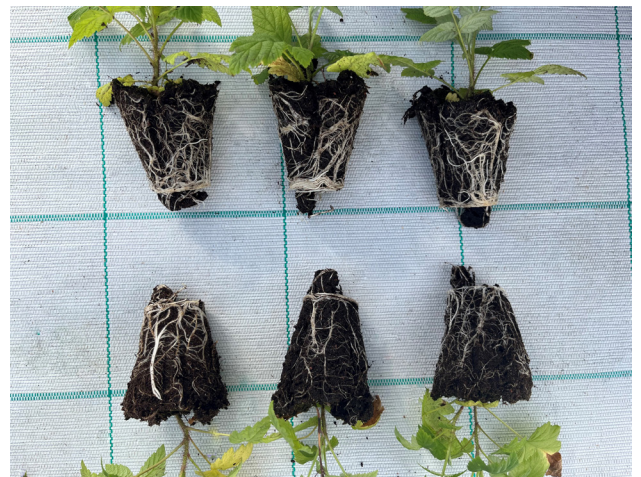
LALRISE VITA nopeuttaa juurten kehittymistä. Kuvassa vadelman 'Muskoka' juuripistokastaimet, ylhäällä LALRISE VITA-käsittely, alhaalla käsittelemättömät taimet. Viljelmäkoje Suomi 2023.