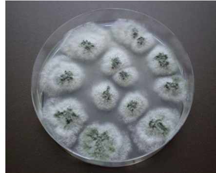
Clonostachys rosea -torjuntasieni

Mikrobijauhe ei ole arka kosteudelle, joten se ei paakkuunnu avomaalla käytettäessäkään. Se myös tarttuu hyvin pölytyslennolle lähteisiin hyönteisiin. Torjuntasieni asuttaa kuivuvat kukan osat estäen ennalta harmaahomeen pääsyn kukkapohjukseen.