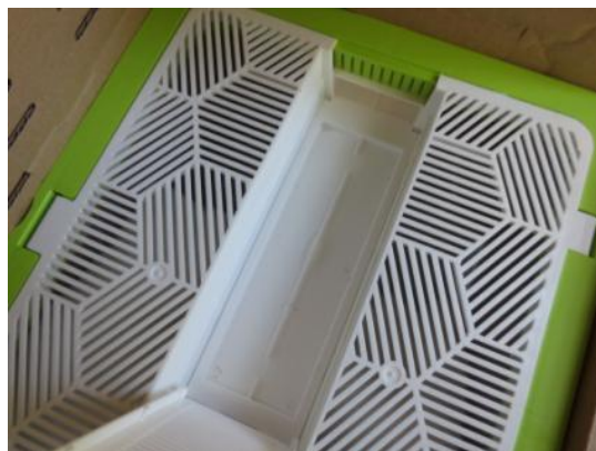
Kimalaispesään valmiiksi asennettu mikrobilevitin.

Varmista kasvinsuojeluaineen turvallinen käyttö. Lue aina pakkausmerkinnät ja tuotetiedot ennen käyttöä.