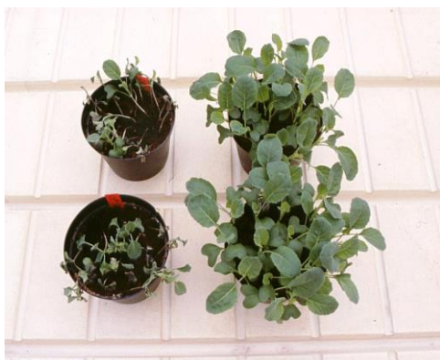
Vas. Alternaria -taimipolte Oik. Alternaria -taimipolte + Mycostop-peittaus